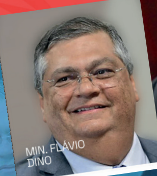
MIN. FLÁVIO DINO