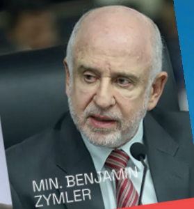
MIN. BENJAMIN ZYMILER