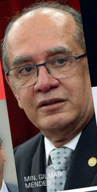
MIN. GILMAR MENDES