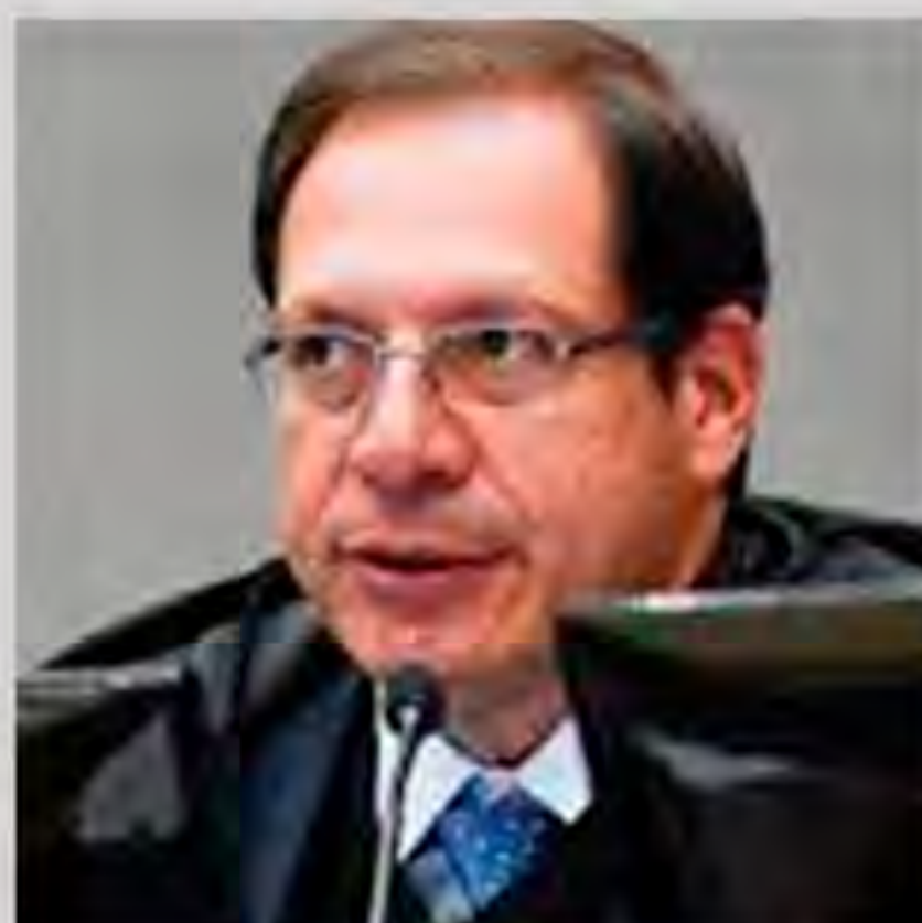
Luiz Felipe Salomão Ministro do Superior Tribunal de Justiça (STJ).